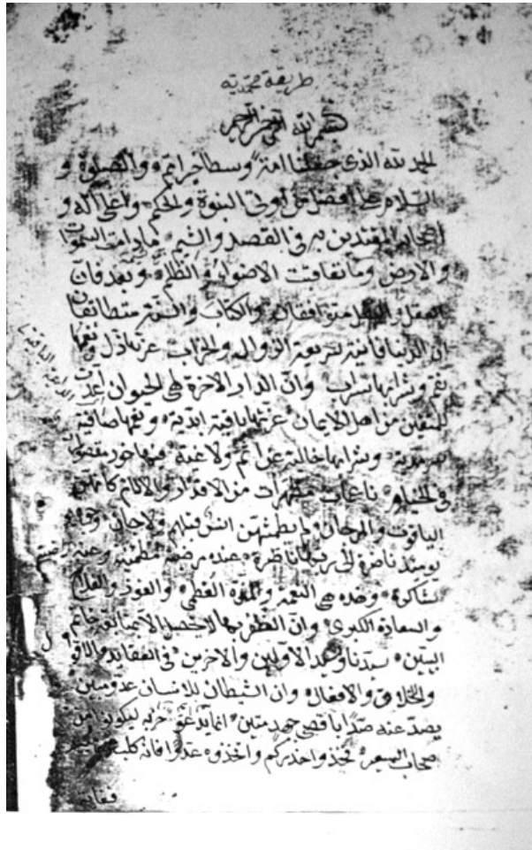
Faksimili i faqes së parë të dorëshkrimit "Et-Tarikatu el-Muhamedijjeh"